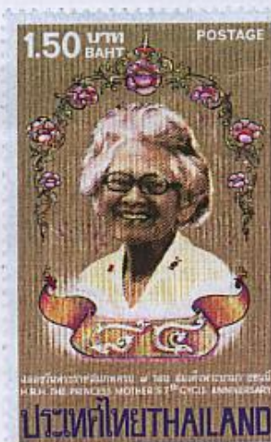
Anniversaire de la reine, mère du roi Rama IX.

La faune et la flore locales sont bien représentées: orchidées et éléphants, entre autres. Les faits historiques thaïlandais et les événements liés à la dynastie en place tiennent un