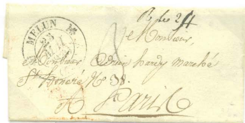
Timbre à date au type 12, Melun 23 Mai 1830, lettre à destination de Paris. Lettre voyageant en port du , taxée à 2 décimes. Tarif du 1 er Janvier 1828, lettre de bureau à bureau, jusqu' à 10gr et jusqu' à 40km.