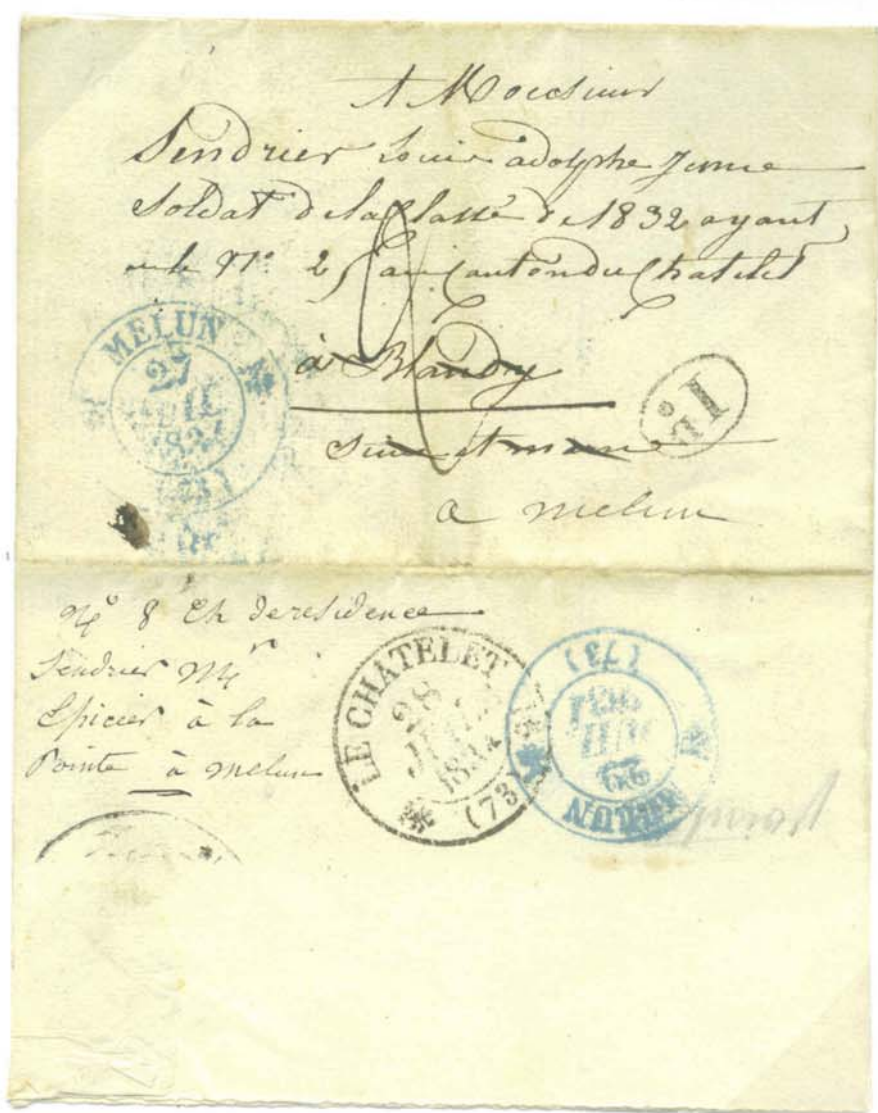
Timbre type 12 bleu 1 fleuron