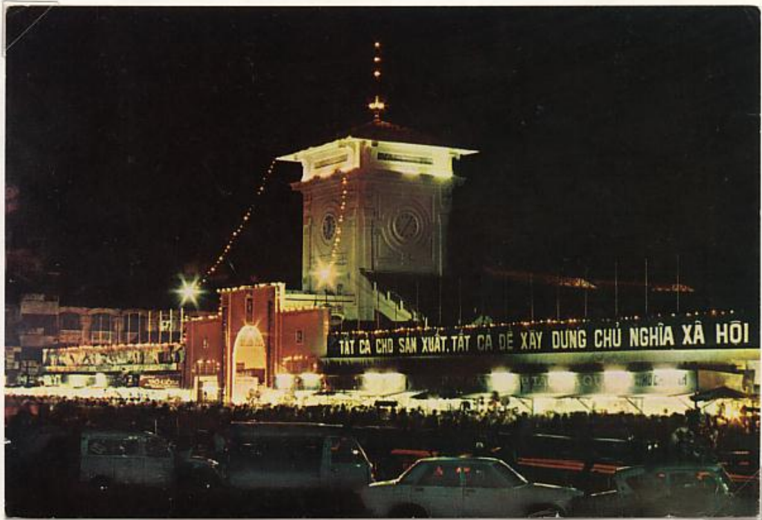
Marché central BEN-THANH de SAIGON