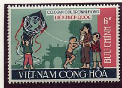
Le cerf-volant, jouet populaire