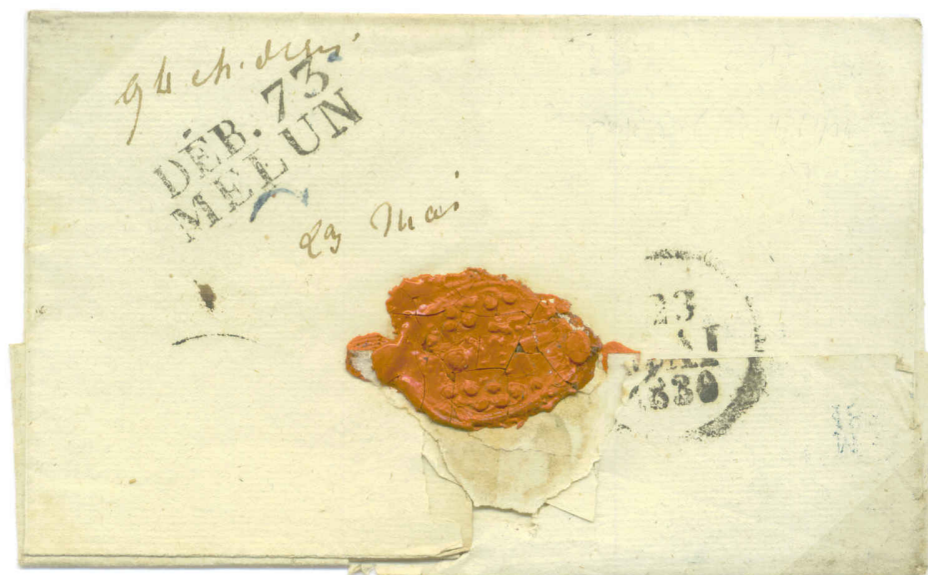
Lettre du 8 Juin 1827 de Paris, pour Mr. Le Directeur de l'enregistrement des domaines, à Melun. Lettre refusée faute d'affranchissement, Déboursé de Melun.