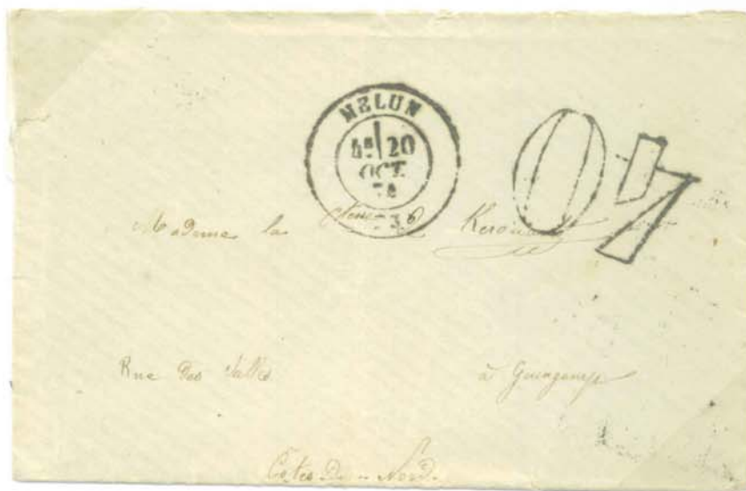
Timbre à date au type 17, Melun 20 Octobre 74, lettre à destination de Guingamp. Lettre voyageant en port du , taxée à 40c. Tarif du 1 er Septembre 1871, lettre de bureau à bureau jusqu' à 10gr.