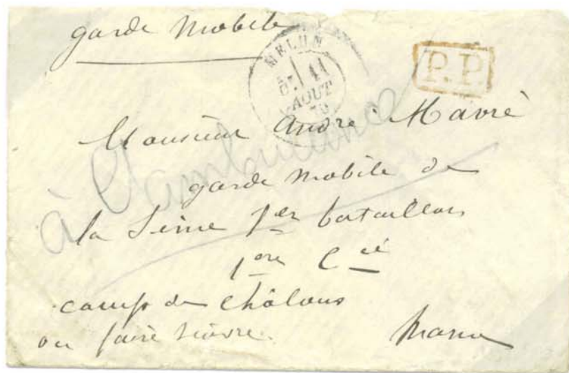
Timbre à date au type 17, Melun 11 Aout 70, lettre à destination de Chalons sur Marne. Lettre voyageant en franchise de port , indiqué par le timbre oblitérant P.P. en rouge . Tarif du 24 Juillet 1870, lettre de bureau à bureau jusqu' à 10gr.