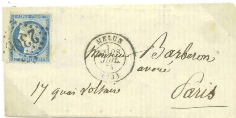
Timbre à date au type 17, Melun 28 Juillet 1875, lettre à destination de Paris. Lettre affranchie par timbre-poste Cérés type III, 25c bleu, annulé par le timbre oblitérant à n° d' ordre 2306 de la 2 ème nomenclature. Tarif du 1 er Septembre 1871, lettre de bureau à bureau jusqu' à 10gr.