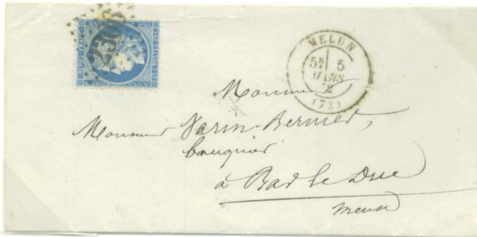
Timbre à date au type 17, Melun 5 Mars 1872, lettre à destination de Bar le Duc. Lettre affranchie par timbre-poste Cérés type I, 25c bleu, annulé par le timbre oblitérant à n° d' ordre 2306 de la 2 ème nomenclature. Tarif du 1 er Septembre 1871, lettre de bureau à bureau jusqu' à 10gr.

Le plus urgent était la création de deux nouvelles valeurs : 15c et 25c, conséquence de la loi du 24 août 1871 relevant la taxe des lettres. Elles parurent en septembre 1871. Les autres valeurs ne suivirent que progressivement et en attendant on continua à utiliser et à imprimer l' effigie de l' Empereur.